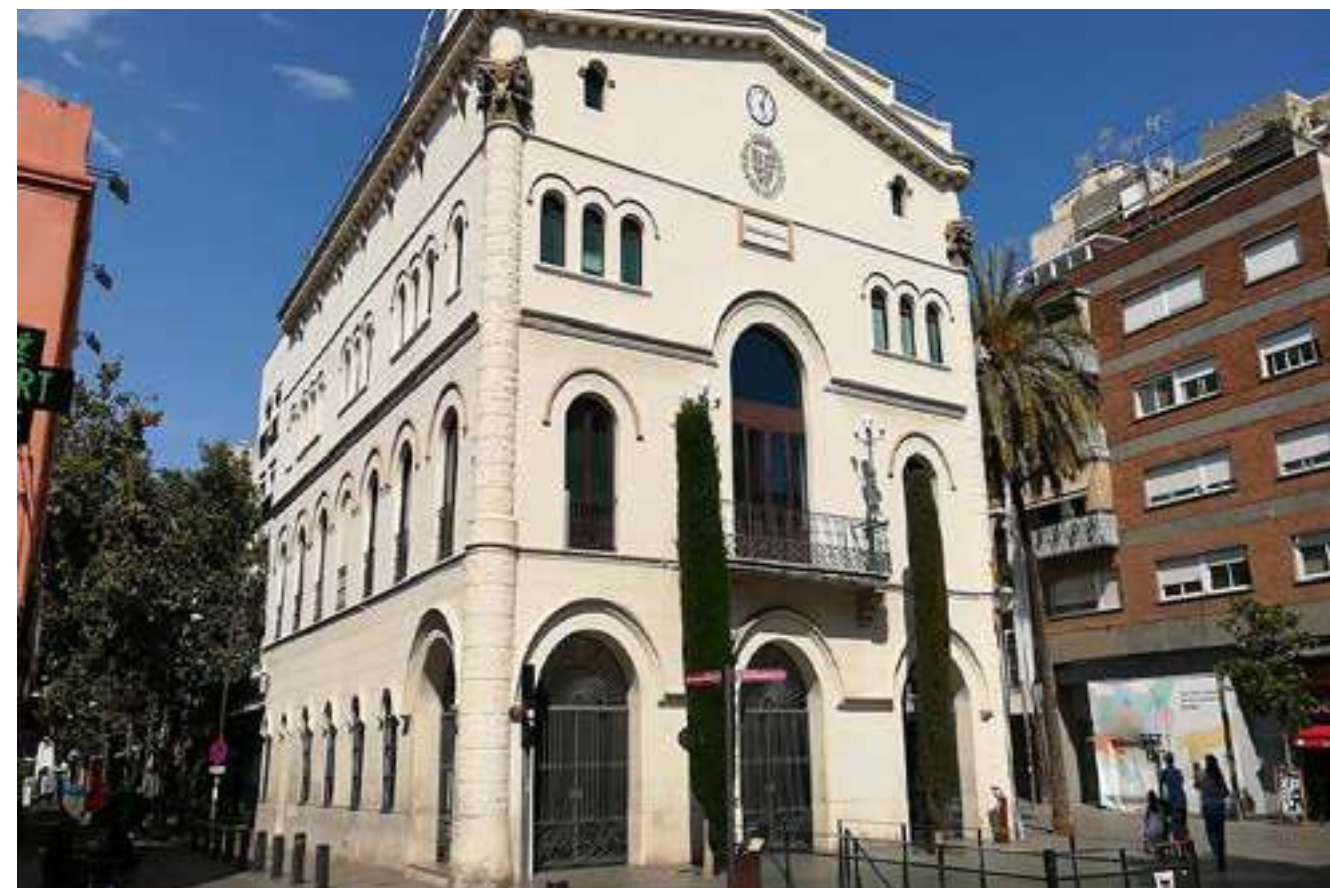
Ajuntament de Badalona