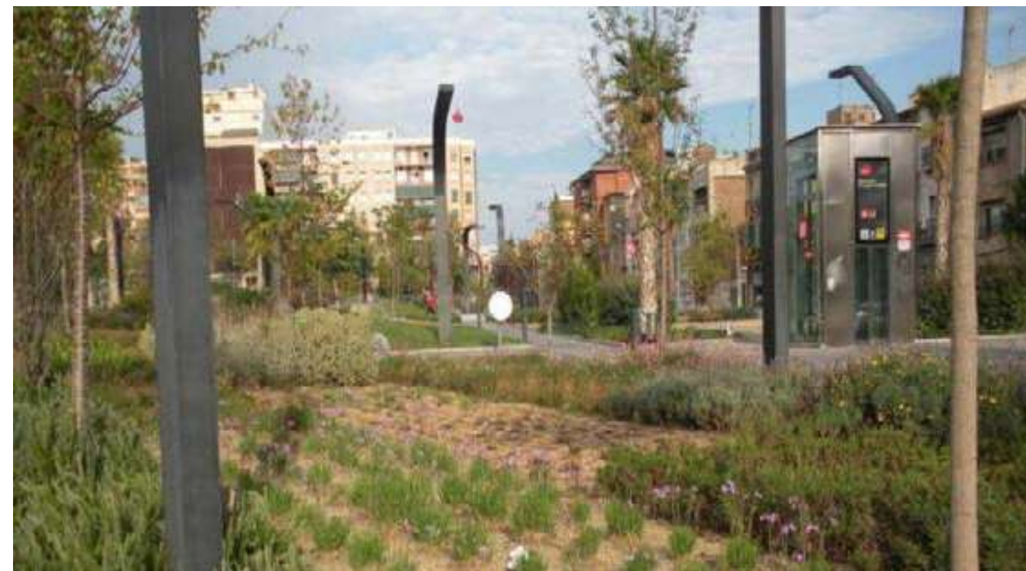
Plaça Pompeu Fabra