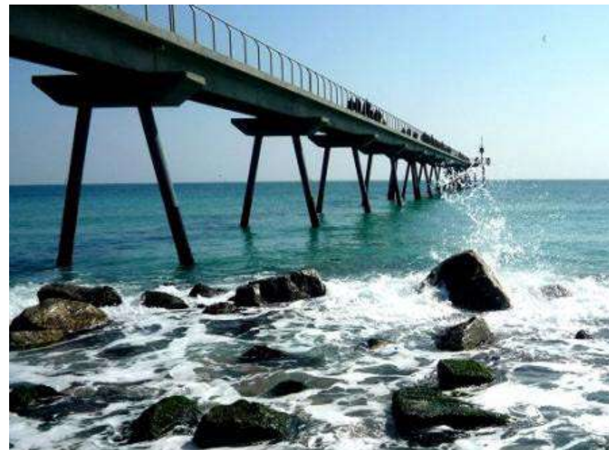
Pont del Petroli