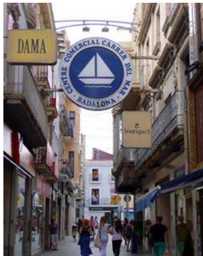
Carrer del Mar