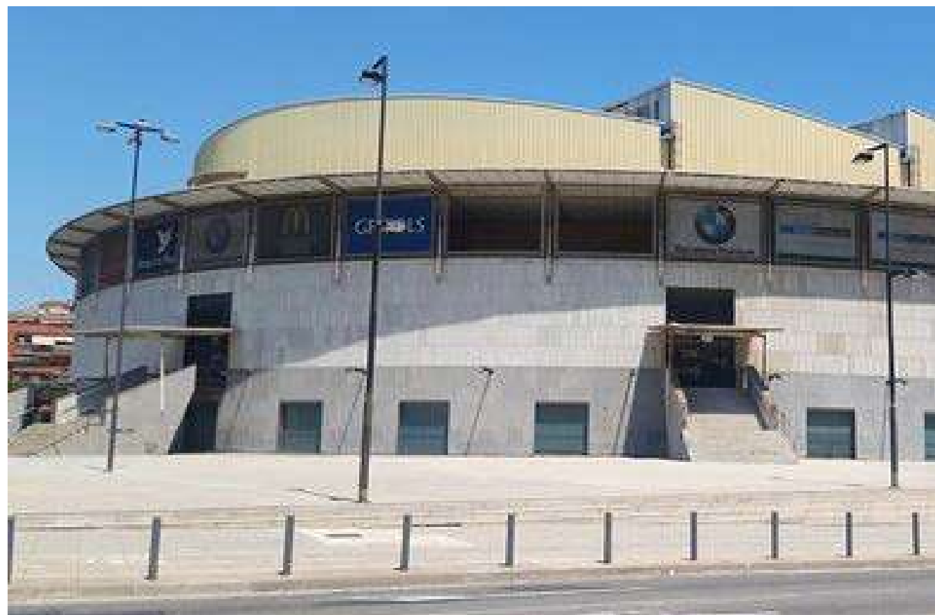
Palau d'Esports de Badalona