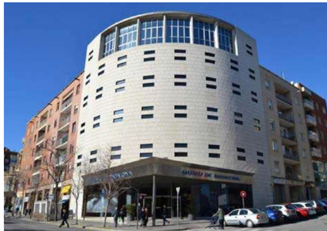
Museu de Badalona