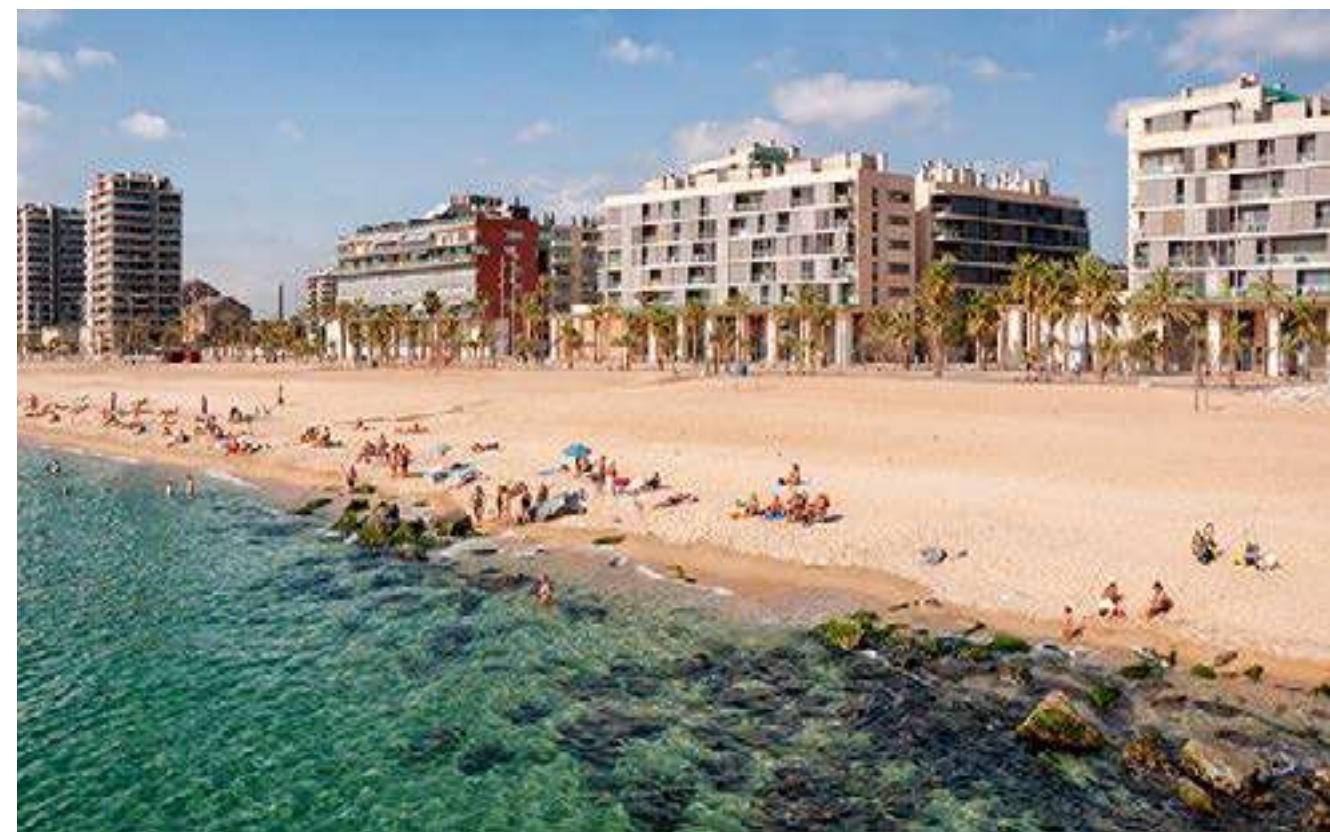
Platja Pont del Petroli