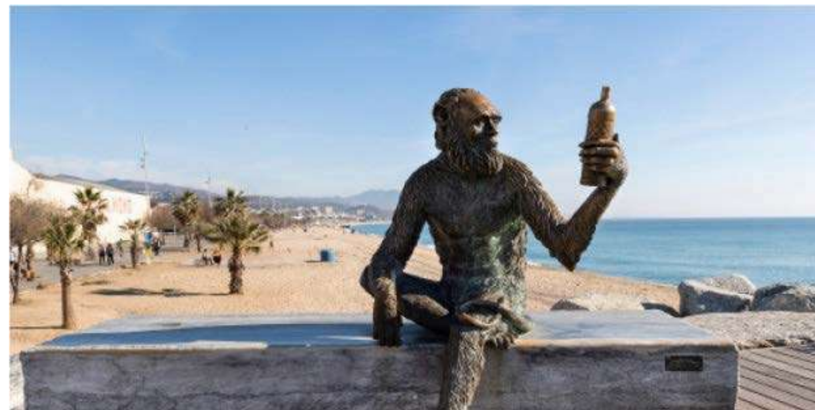
Anís del Mono