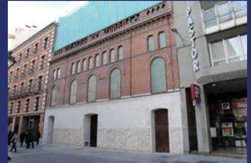
Teatro Zorrilla. Ideado por el arquitecto Jaume Botey y Garriga e inaugurado el 31 de octubre de 1868. Se construyó tomando como modelo el teatro barroco italiano.