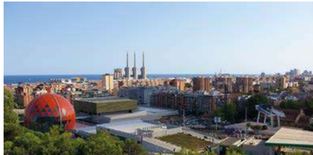
Turó d'en Caritg.