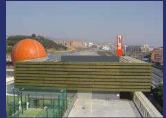
Màgic Badalona. Tiendas, restauración, cine, gimnasio y pistas de baloncesto.