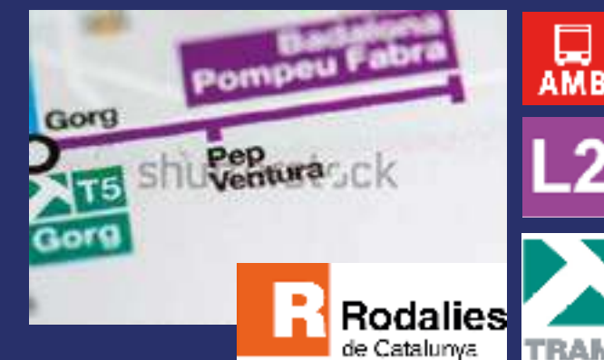
Àmplia red de transporte