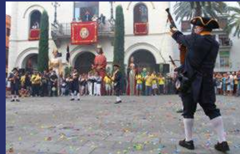
Fiestas y tradiciones en la plaza del Ayuntamiento de Badalona.