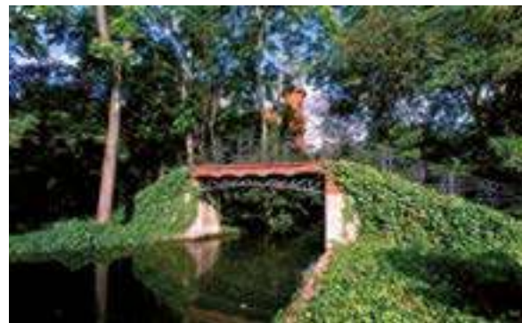
Parque de Can Solei y Ca L'Arnús (10,8 ha.)