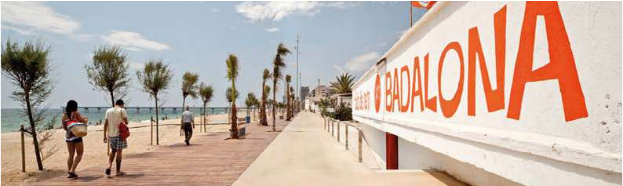
Paseo Marítimo de Badalona a 5 minutos desde la promoción.

Badalona dinámica El Edificio Balcó del Mar se encuentra situado en el barrio de la Mora Port Badalona que forma parte del Distrito V junto con Gorg, Arrabal, Congrés y Can Claris. En el barrio de La Mora destaca el Port de Badalona, el paseo marítimo de la ciudad, el Pont de Sant Lluç y la playa de la Mora. Una ciudad que se ha implicado en una transformación urbana con el objetivo de crear un nuevo modelo urbano. Una ciudad en constante dinamismo y transformación que conserva un gran patrimonio histórico-artístico, gran oferta cultural, servicios al ciudadano y el privilegio de estar rodeado de mar y montaña. Cerca de la promoción encontramos el metro Pep Ventura y Gorg, Tram Gorg, Servicio de Cercanía-Renfe y red de autobuses.