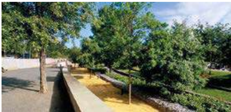
Parque de la Riera de Canyadó (2 ha.)