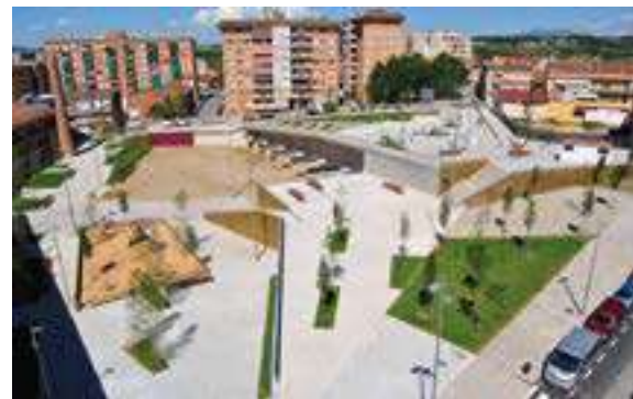
Parque de la Bòbila (3,5 ha.)