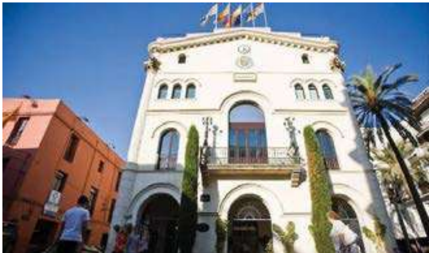
Plaza del Ayuntamiento. Casa de la Vila.