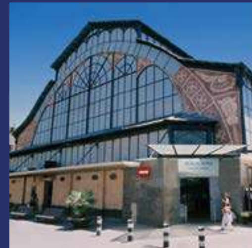
Mercat Municipal de Torner