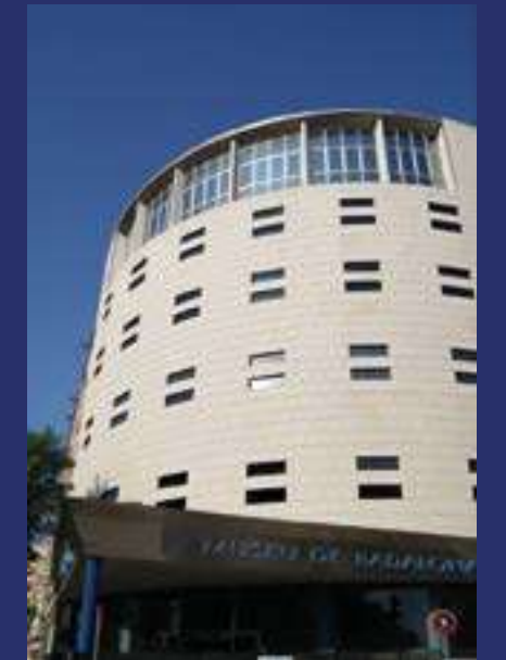
Museu de Badalona. Inaugurado en 1966. Se pueden visitar los restos de la ciudad romana en el subsuelo del edificio.