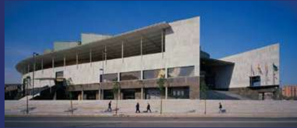
Pabellón Olímpico de Badalona.