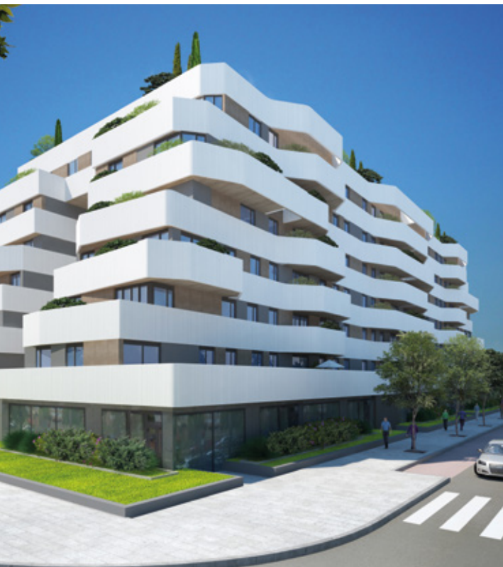
RESIDENCIAL ROTTERDAM - CAÑAVERAL