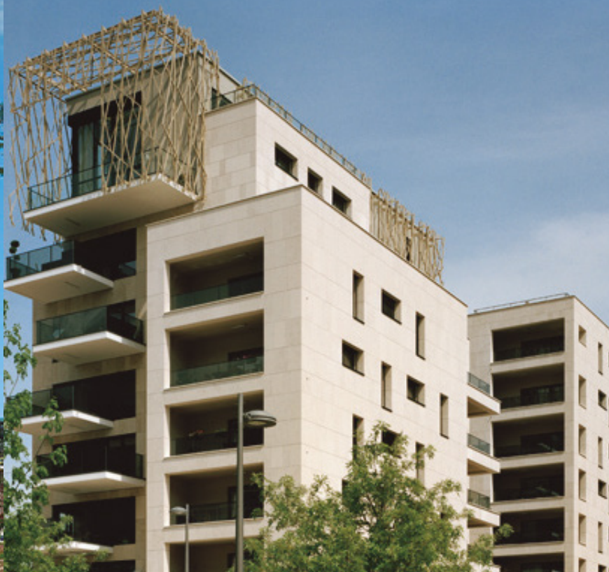
LYON - CONFLUENCE