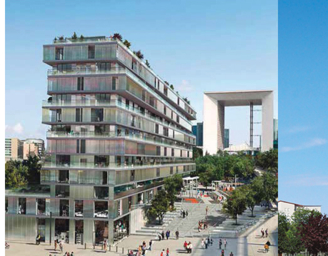
EDIFICIO ONE - PARIS

Nuestra estructura empresarial une la fuerza, el rigor y la solvencia de la dimensión internacional con la agilidad y la eficiencia de una organización descentralizada, disponiendo en España desde el año 1989 de delegaciones territoriales en Madrid y Cataluña.