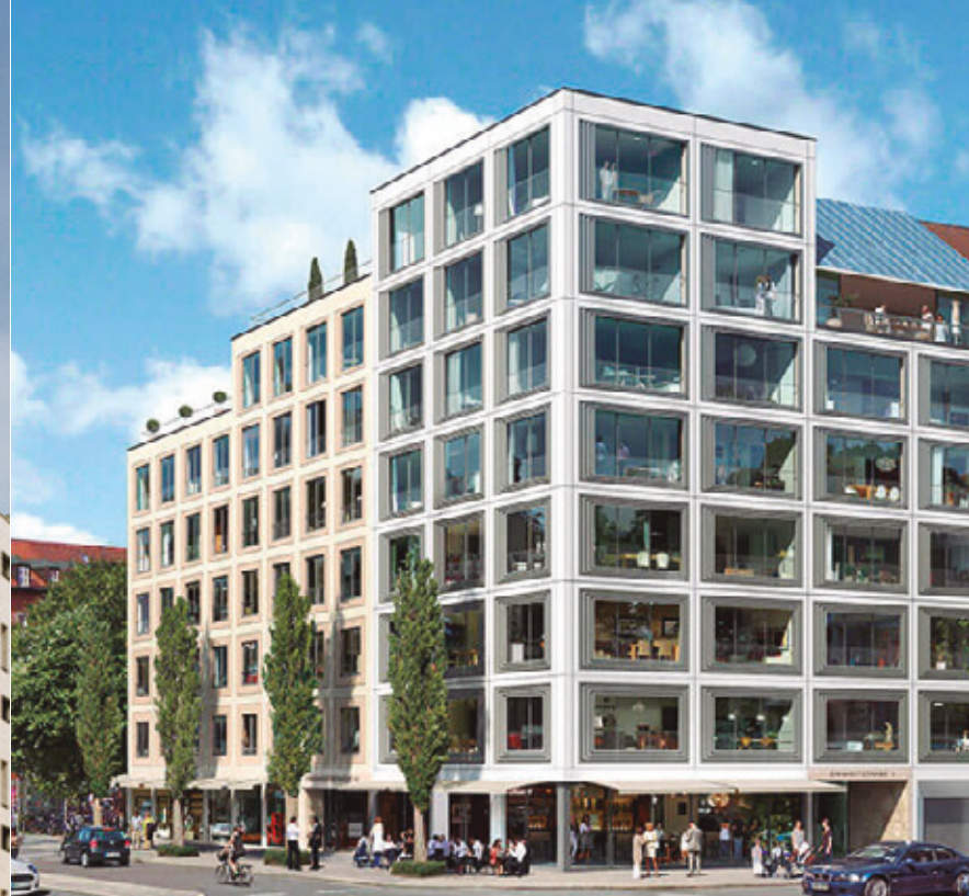
GLOCKENBACH SUITES - MUNICH