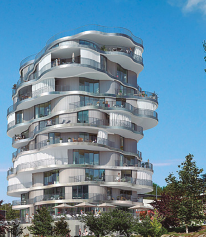
FOLIE DIVINE - MONTPELLIER