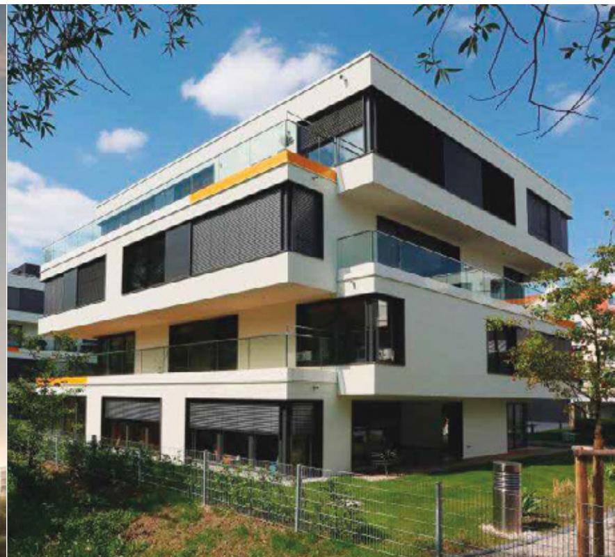
THALKIRCHEN - MUNICH