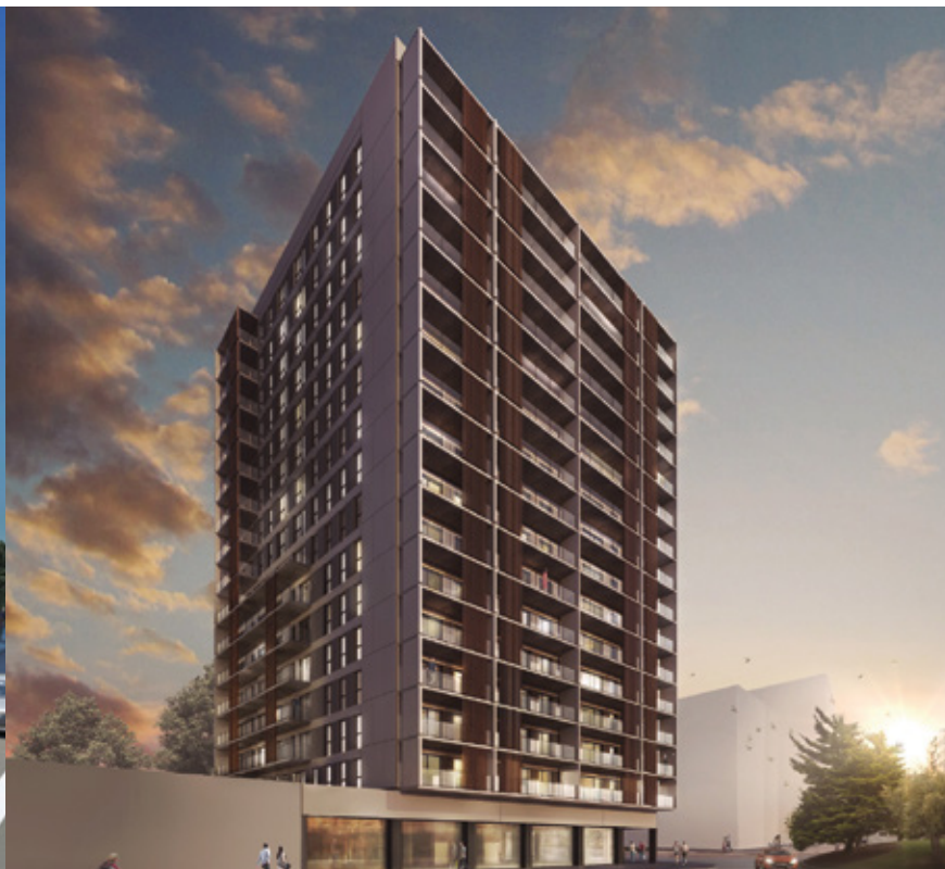
EDIFICI LH CENTER TOWER - BARCELONA