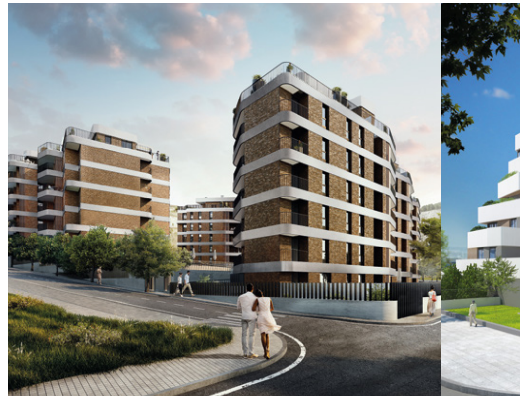
RESIDENCIAL MELBOURNE - RIVAS