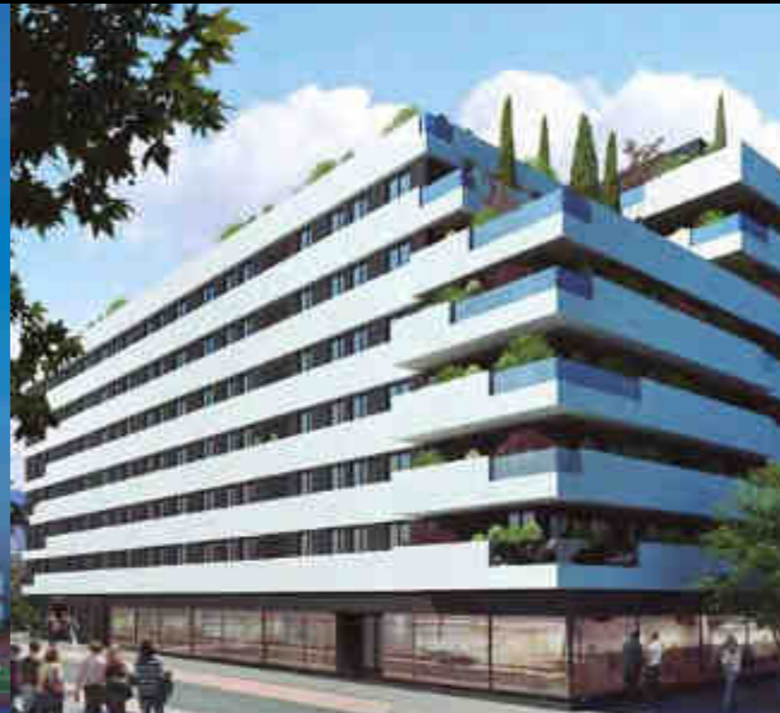
RESIDENCIAL BRUSELAS - RIVAS