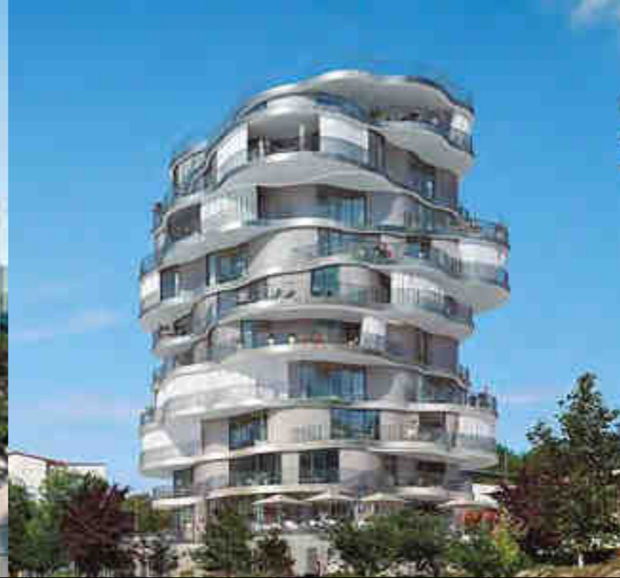
FOLIE DIVINE - MONTPELLIER