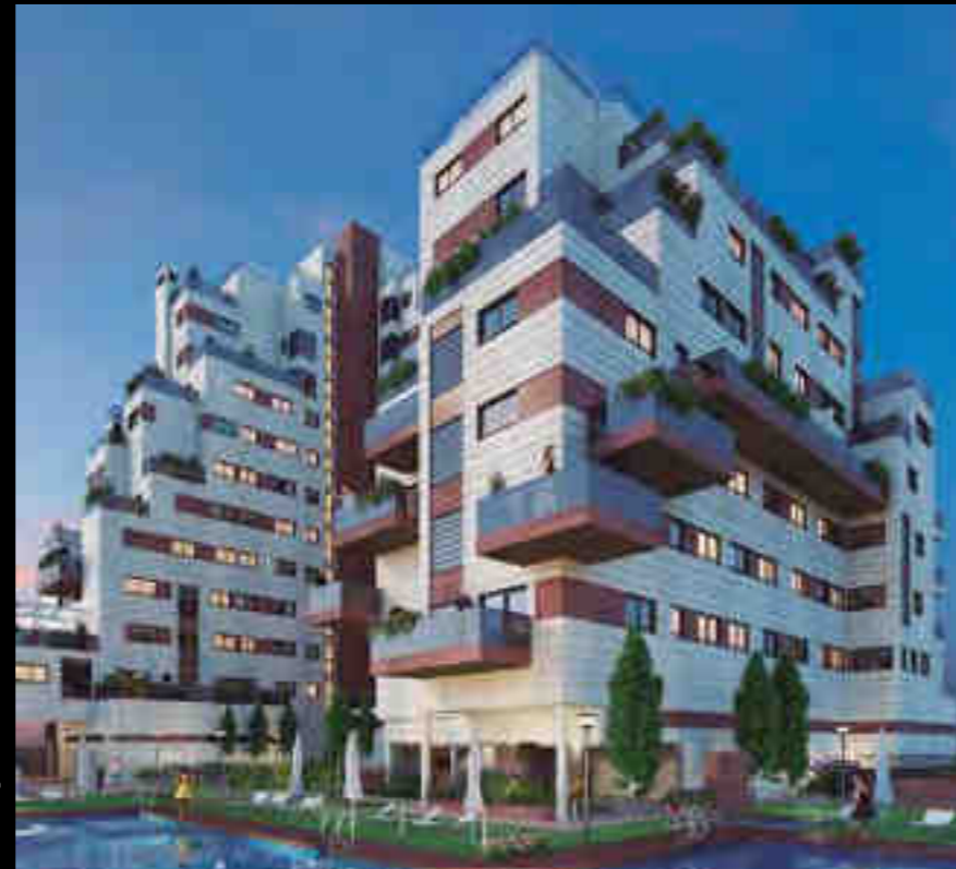
RESIDENCIAL LOIRA - MADRID