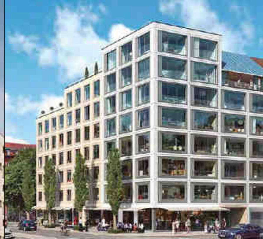
GLOCKENBACH SUITES - MUNICH