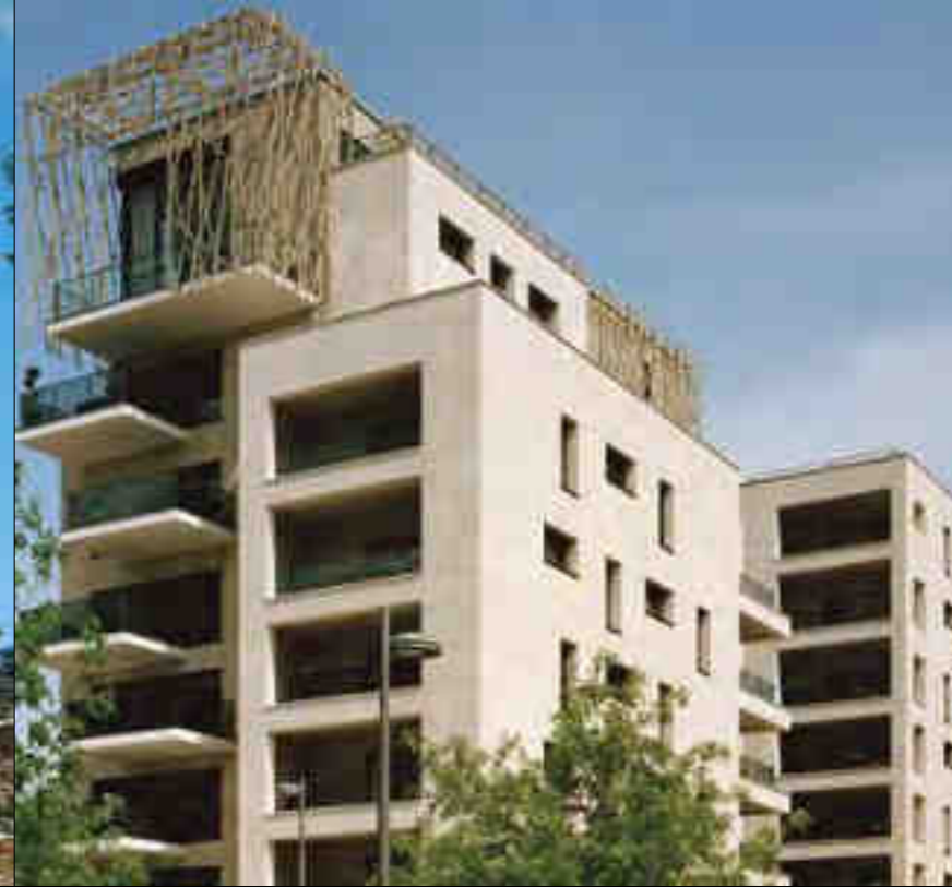
LYON - CONFLUENCE