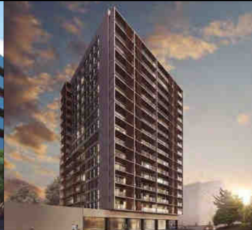
EDIFICIO LH CENTER TOWER - BARCELONA