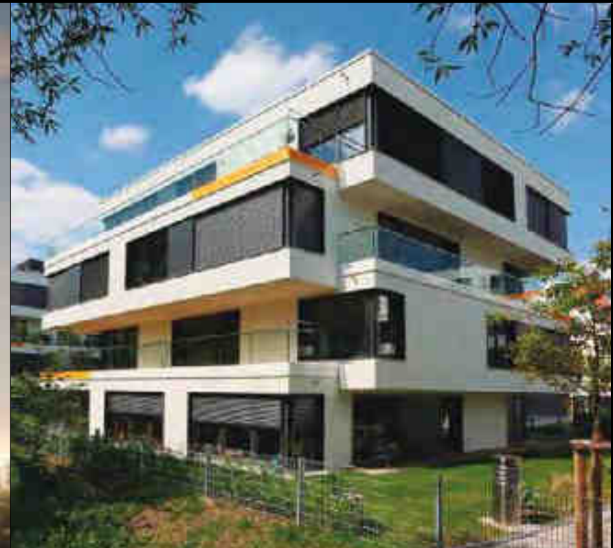
THALKIRCHEN - MUNICH