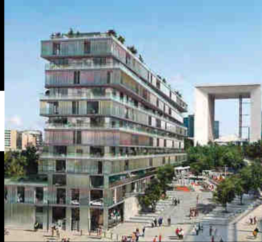
EDIFICIO ONE - PARIS